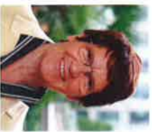
Schirmherrin der „Insel Tobi“ ist Prof. Dr. Rita Süßmuth