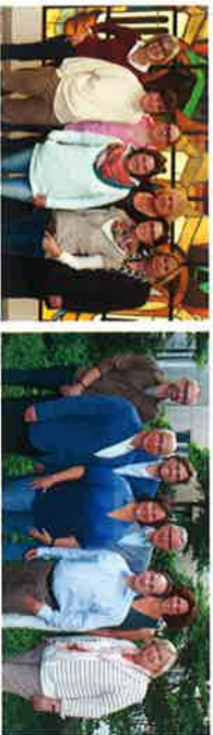
Team der Palliativstation und Vorstand der „Insel Tobi e.V.“

Das Team der Palliativstation steht jederzeit gerne für Interessierte zur Verfügung, die sich vor Ort informieren wollen oder mehr über die palliativmedizinische Versorgung von Kindern erfahren möchten.